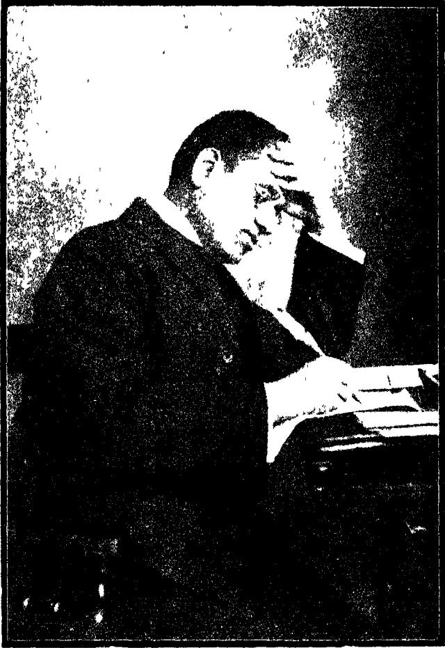
लेखक ( १९०८ में )